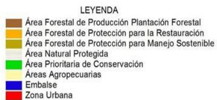
Figura 1. Visión global de la Zonificación forestal del Municipio de tierralta